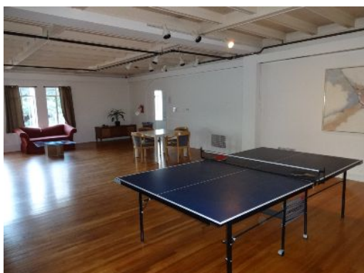
Westwood Hall 内 ラウンジ 卓球台

放課後は、ほとんどクラスメイトや寮の友達と卓球をしていました。授業をする建物の帰り道に、おいしいタピオカ屋さんがあり、卓球で負けた人がご馳走するゲームをしたりしていました(笑)。週末はユニバーサルスタジオに行ったり、サンタモニカにお買い物に行きました。