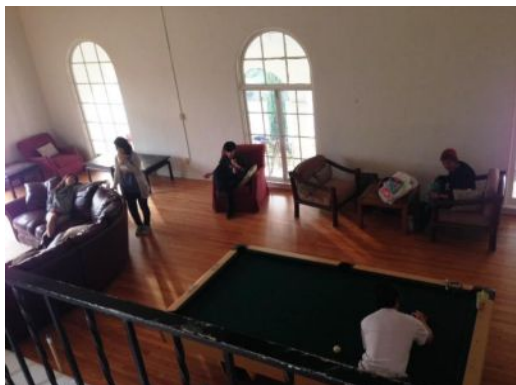
Westwood Hall ラウンジ

バスケ、ビリヤード、最終日前夜にはBBQなどもしました。寮の友達やクラスメイト関係なく友達になり、みんなでわいわい楽しめたことがとても良かったと思います。