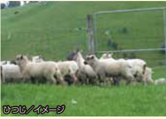
ロトルアイメージ