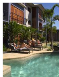
★ホリデーアパート/イメージ