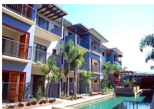
★ホリデーアパート外観イメージ

滞在は現地家庭でのホームステイ（1日2食提供）または自炊可能なホリデーアパート（コンドミニアム）よりお選びいただけます。