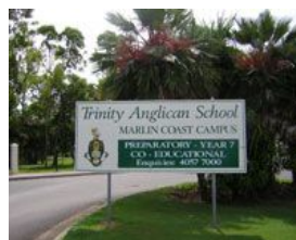
★現地小学校概観イメージ