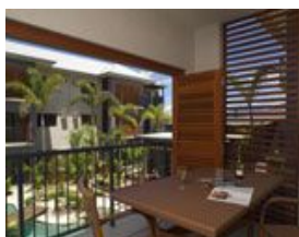
★ホリデーアパート/イメージ