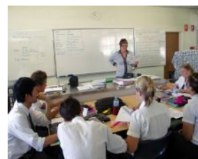
★現地小学校授業風景イメージ